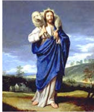
Le Bon Pasteur Philippe de Champaigne Musée des Ursulines Mâcon - France

"L'animal n'est là qu'au service de l'homme, qui peut en user et abuser à volonté".