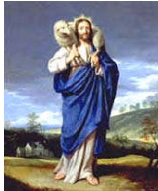
Le Bon Pasteur Philippe de Champaigne Musée des Ursulines Mâcon - France

“ El animal está aquí para servir el hombre, quien puede usar y abusar del animal tal como le apetece.”